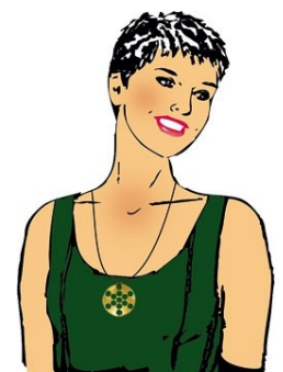
Comment porter le pendentif