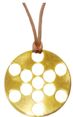
Fruit de Vie, plaqué or Diamètre: 3.615 cm

Le port du pendentif demande une période d'adaptation. Aussi, il ne doit pas être porté de manière permanente dès le début, mais à raison de quelques heures maximum, ou tant que vous vous sentez bien avec lui. Chaque organisme est différent et doit s'habituer selon son propre rythme! Après une période d'adaptation progressive, le Fruit de Vie pourra alors être porté toute la journée selon vos besoins et votre ressenti.