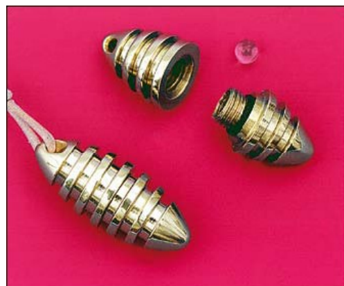
Poids: 20 grammes

Sans elle le Vitalon ne fonctionne pas !