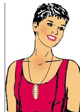
Le Vitalon se porte sur le plexus solaire